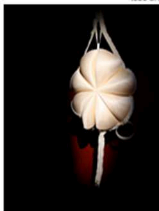
Tia Calli Borlase © Artais -art contemporain - avril 2011