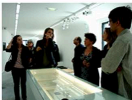
© Artais -art contemporain - avril 2011