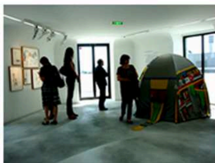
Lucy et Jorge Orta © Artais -art contemporain - avril 2011