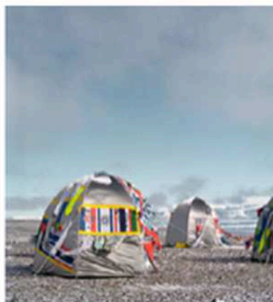
Antarctic Village (2007) - © Lucy et Jorge Orta Court - tous droits