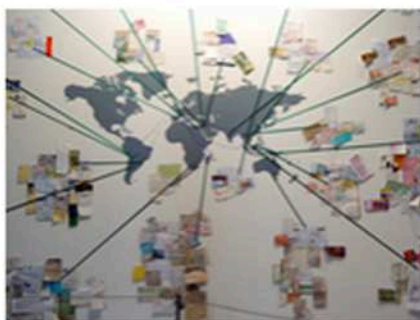
Yann Dumoget © Artais -art contemporain - avril 2011